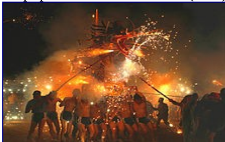
Una danza del drago (舞龙) di fuoco durante la celebrazione del capodanno cinese in Cina

La cultura cinese ( cinese : 中國文化 T , 中国文化 S , Zhōngguó wénhuà P ) è una delle più antiche del mondo, risalente a migliaia di anni fa. L'area in cui essa è dominante copre una vasta regione geografica dell' Asia orientale con usanze e tradizioni che variano grandemente tra province , grandi e perfino piccole città. Componenti importanti della cultura cinese sono la ceramica , l' architettura , la musica , la letteratura , le arti marziali , la cucina , le arti visive , la filosofia e la religione .