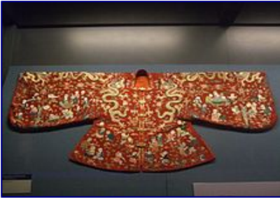
Abbigliamento tradizionale della dinastia Ming noto come hanfu (汉服)