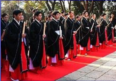
Uomini e donne in abiti formali xuanduan a una cerimonia confuciana in Cina

Le diverse classi sociali in diverse ere vantano diverse tendenze di moda: il colore giallo o rosso era riservato solitamente per l'imperatore durante l'era imperiale della Cina. La storia della moda in Cina abbraccia centinaia di anni con alcune delle fogge più colorate e più varie. Durante la dinastia Qing avvenne un drammatico cambio di abbigliamento, i cui esempi includono il cheongsam (o qipao in mandarino). L'abbigliamento dell'epoca prima della dinastia Qing è denominato hanfu o abbigliamento tradizionale dei cinesi han. Molti simboli come la fenice sono stati usati per fini decorativi come pure economici.