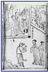
Illustrazione cinese del XVIII secolo di una scena da Viaggio in Occidente (西游记), in alto da sinistra a destra: Tang Sanzang e Sun Wukong , in basso a sinistra: Zhu Bajie

Una tradizionale porta rossa cinese con il battaglio a forma di leone guardiano cinese , che assomiglia al numero 8 (buona sorte o fortuna) nella cultura cinese