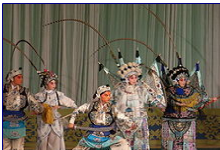
Un'esibizione dell' opera cinese a Pechino nota come opera di Pechino (京剧)