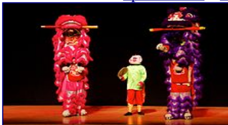
La popolare danza del leone (舞狮) cinese durante la cerimonia di apertura di Wikimania nel 2013