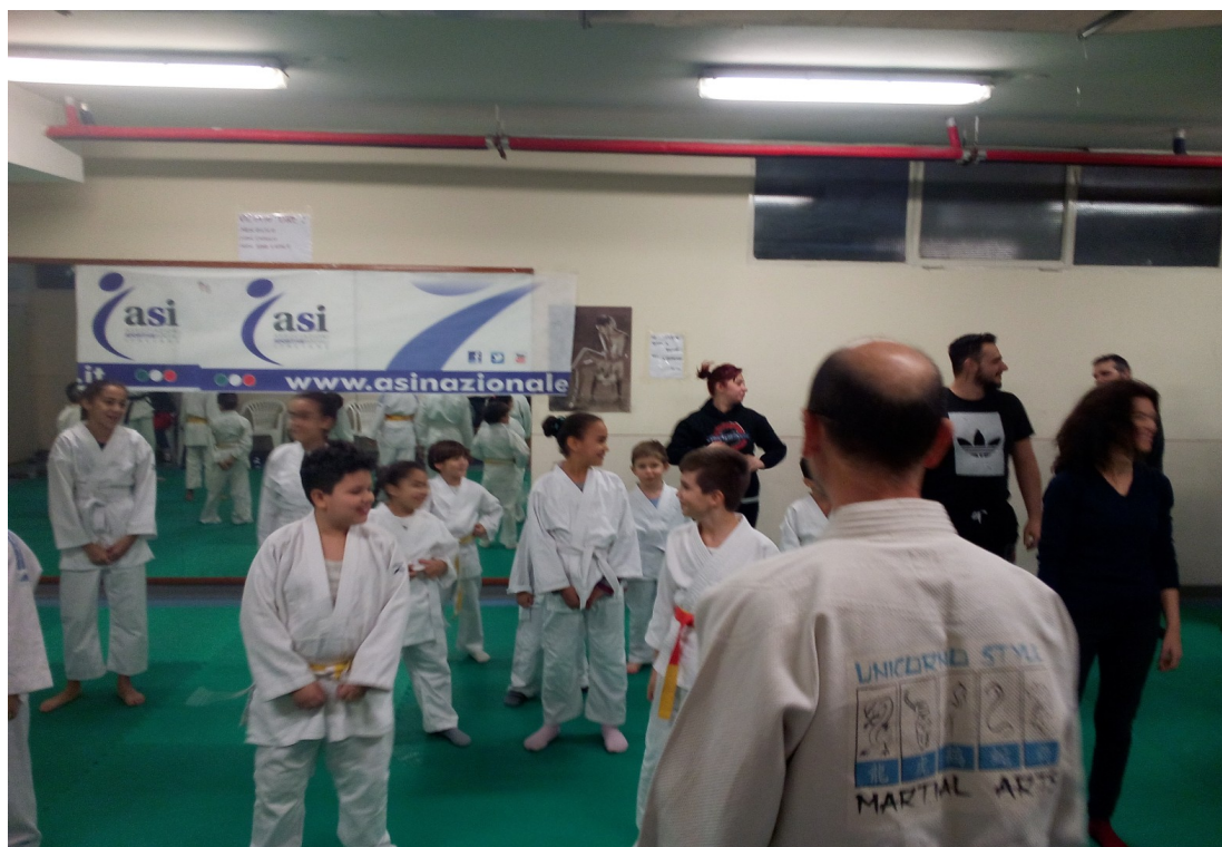
"Festa Arti Marziali (Genitori contro Figli) : Centro di Incontro MASCAGNI 16/12/2018"